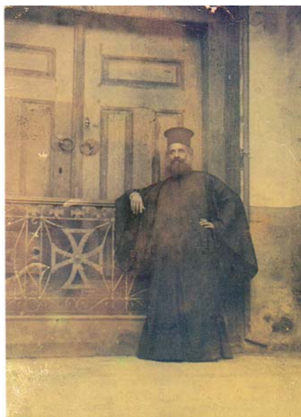
Ο μητροπολίτης Αμασειας Γερμανός στην πόρτα του Πατριαρχείου, όπου απαγχονίστηκε ο Γρηγόριος Ε΄ (Αντιγόνη Μπέλλου-Θρεψιάδου, ό.π., παρένθετη φωτογραφία ).