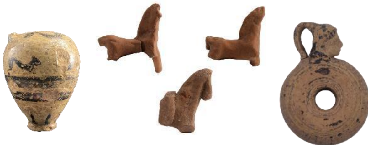
ΕΙΚ. 18: ΕΥΡΗΜΑΤΑ ΑΠΟ ΤΟ ΕΣΩΤΕΡΙΚΟ ΤΟΥ ΑΠΟΘΕΤΗ