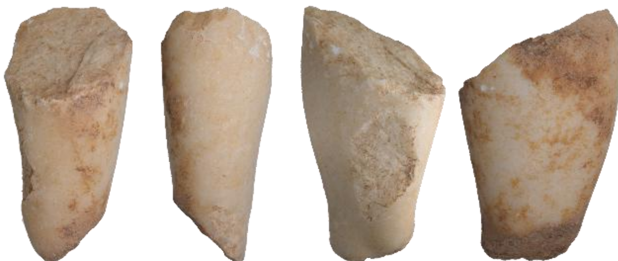
ΕΙΚ. 20: ΤΜΗΜΑ ΜΗΡΟΥ ΑΠΟ ΜΑΡΜΑΡΙΝΟ ΚΟΥΡΟ ΦΥΣΙΚΟΥ ΜΕΓΕΘΟΥΣ