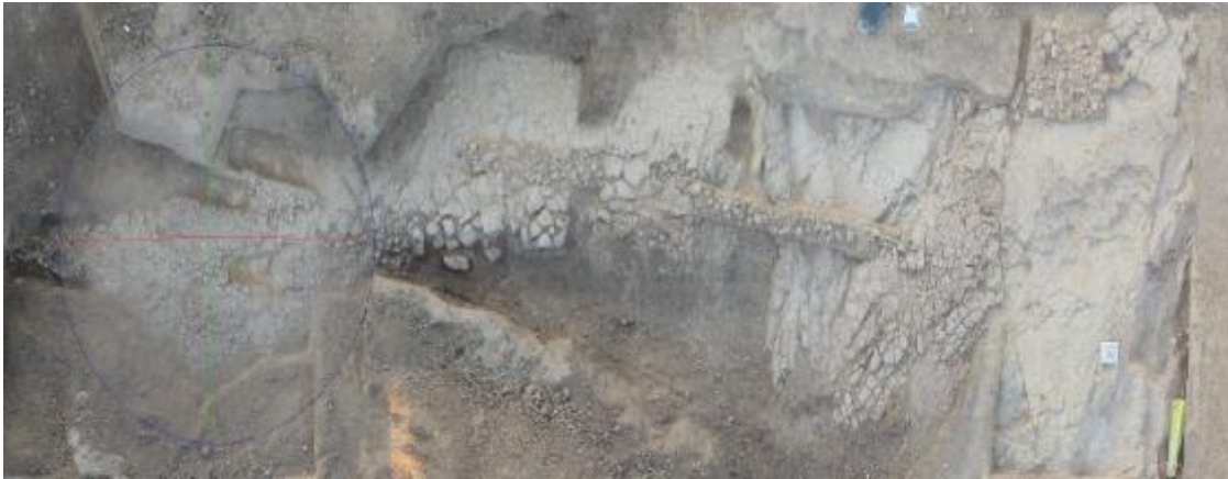
ΕΙΚ. 15: ΑΡΧΑΙΟΣ ΔΡΟΜΟΣ