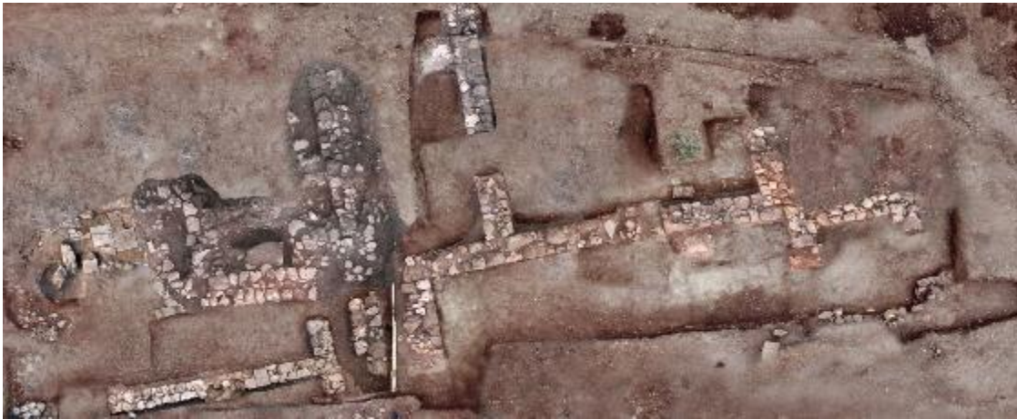
ΕΙΚ. 16: ΟΙΚΙΣΤΙΚΑ ΚΑΤΑΛΟΙΠΑ