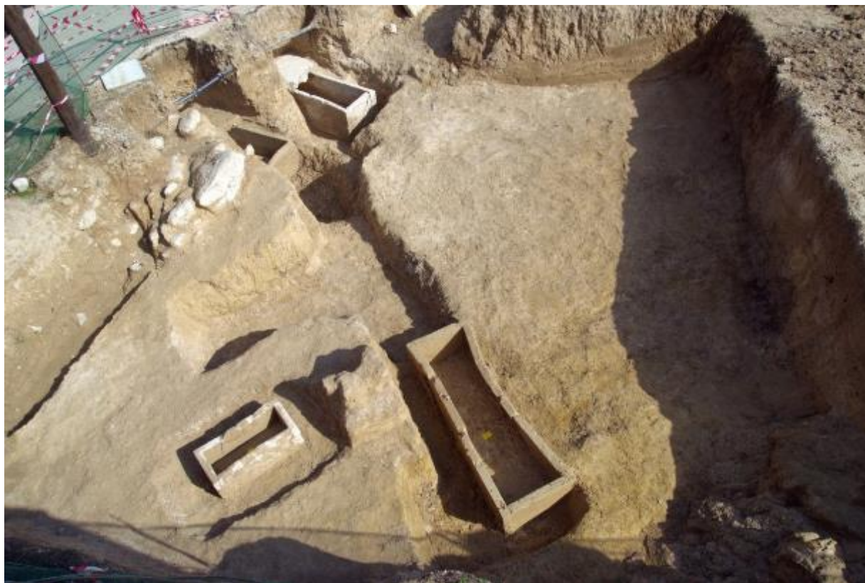
ΕΙΚ. 2: ΤΜΗΜΑ ΤΟΥ ΑΝΕΣΚΑΜΜΕΝΟΥ ΑΡΧΑΪΚΟΥ ΝΕΚΡΟΤΑΦΕΙΟΥ