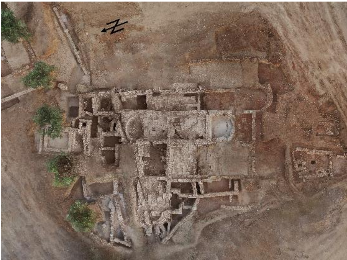
ΕΙΚ. 17: ΛΟΥΤΡΟ ΡΩΜΑΪΚΩΝ ΧΡΟΝΩΝ