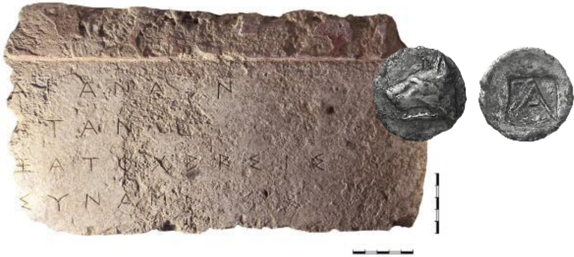
ΕΙΚ. 21: ΔΗΜΟΣΙΑ ΕΠΙΓΡΑΦΗ ΤΟΥ 5 ΟΥ ΑΙ. Π.Χ ΚΑΙ ΑΡΓΥΡΟΣ ΟΒΟΛΟΣ ΑΡΓΟΥΣ