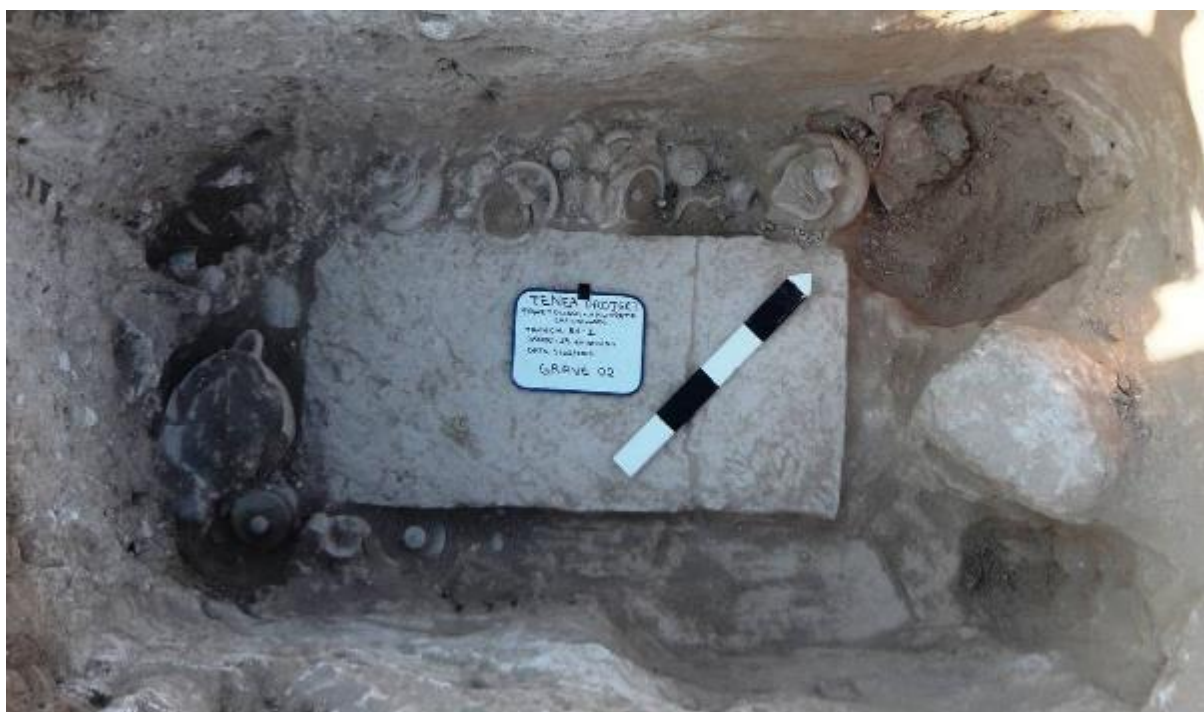
ΕΙΚ. 3: ΠΛΟΥΣΙΑ ΚΤΕΡΙΣΜΕΝΗ ΤΑΦΗ ΑΡΧΑΪΚΗΣ ΠΕΡΙΟΔΟΥ