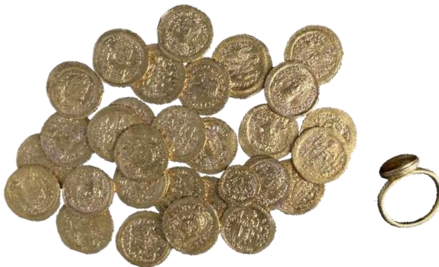
ΕΙΚ. 23: ΘΗΣΑΥΡΟΣ ΧΡΥΣΩΝ ΝΟΜΙΣΜΑΤΩΝ ΚΑΙ ΧΡΥΣΟ ΔΑΚΤΥΛΙΔΙ