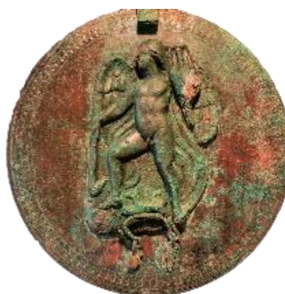
ΕΙΚ. 8: ΧΑΛΚΙΝΟ ΚΑΤΟΠΤΡΟ ΜΕ ΠΑΡΑΣΤΑΣΗ