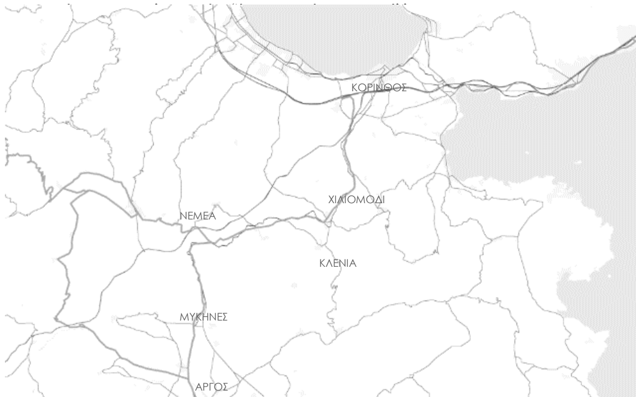
ΕΙΚ. 1: ΧΑΡΤΗΣ ΤΗΣ ΑΡΓΟΛΙΔΟΚΟΡΙΝΘΙΑΣ

καλλιεργηθεί μεταξύ των κατοίκων και των μνημείων, με βασικό διάμεσο σε αυτή την πολιτιστική διάδραση και εξέλιξη το ανασκαφικό πρόγραμμα της Τενέας. Η αρχαιολογία είναι ανθρωπιστική επιστήμη και έχει ως βάση τον άνθρωπο και τη σχέση του με τα αρχαία τέχνηρα και τεκμήρια 27 . Είναι η επιστήμη που μέσα από αυτήν τη σχέση επιδιώκει να ανακαλύψει πτυχές του παρελθόντος, ώστε να ενισχύσει