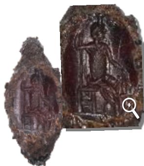
ΕΙΚ. 12: ΣΙΔΕΡΕΝΙΟ ΔΑΚΤΥΛΙΔΙ ΜΕ ΠΑΡΑΣΤΑΣΗ ΣΑΡΑΠΗ