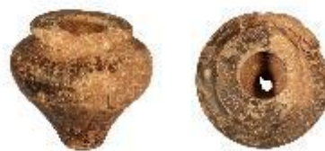
ΕΙΚ. 5: ΑΩΤΟ ΑΓΓΕΙΟ