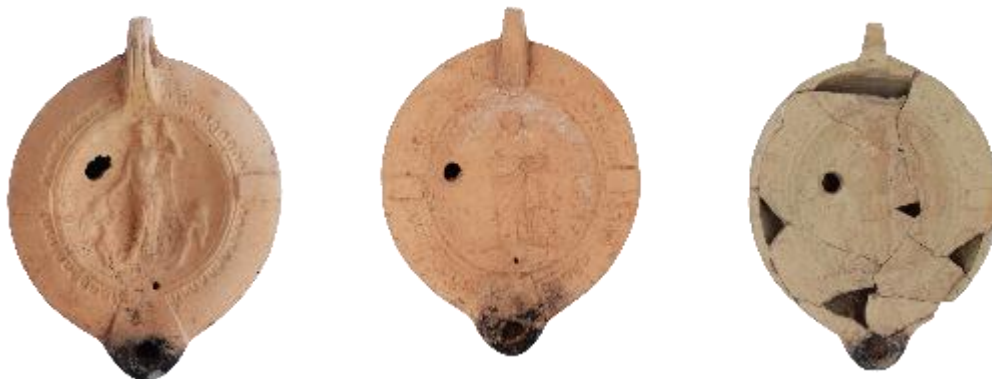
ΕΙΚ. 11: ΛΥΧΝΟΙ ΡΩΜΑΪΚΩΝ ΧΡΟΝΩΝ (ΑΡΙΣΤΕΡΑ ΠΡΟΣ ΔΕΞΙΑ ΑΦΡΟΔΙΤΗ ΜΕ ΕΡΩΤΙΔΕΙΣ, ΥΓΕΙΑ ΚΑΙ ΑΡΤΕΜΙΣ)