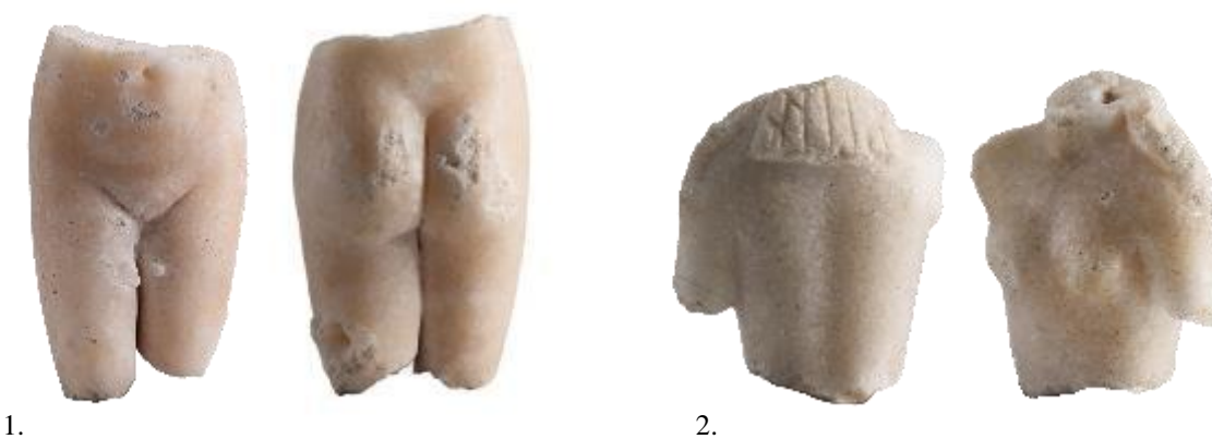
ΕΙΚ. 19: ΜΑΡΜΑΡΙΝΑ ΑΓΑΛΜΑΤΙΔΙΑ ΑΦΡΟΔΙΤΗΣ