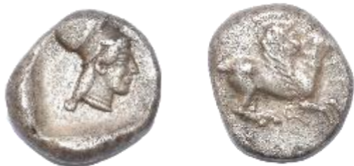
ΕΙΚ. 7: ΣΤΑΤΗΡΑΣ ΚΟΡΙΝΘΟΥ