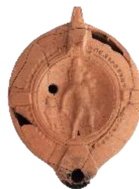
ΕΙΚ. 14: ΛΥΧΝΟΣ ΜΕ ΠΑΡΑΣΤΑΣΗ ΤΟΥ ΑΙΝΕΙΑ ΝΑ ΕΓΚΑΤΑΛΕΙΠΕΙ ΤΗΝ ΤΡΟΙΑ