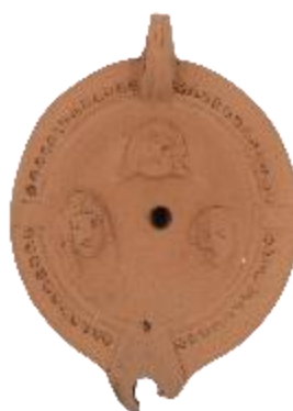
ΕΙΚ. 13: ΛΥΧΝΟΣ ΜΕ ΠΑΡΑΣΤΑΣΗ ΑΠΟ ΠΡΟΣΩΠΕΙΑ ΘΕΑΤΡΟΥ