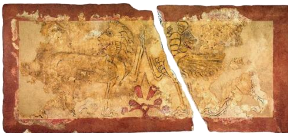
ΕΙΚ. 6: Η ΓΡΑΠΤΗ ΠΩΡΙΝΗ ΚΑΛΥΠΤΗΡΙΑ ΠΛΑΚΑ ΤΗΣ ΣΑΡΚΟΦΑΓΟΥ ΤΟΥ 1984