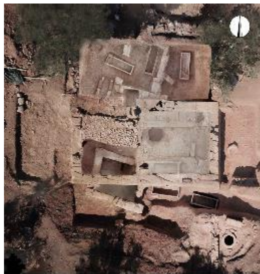
ΕΙΚ. 10: ΡΩΜΑΪΚΟ ΤΑΦΙΚΟ ΜΝΗΜΕΙΟ