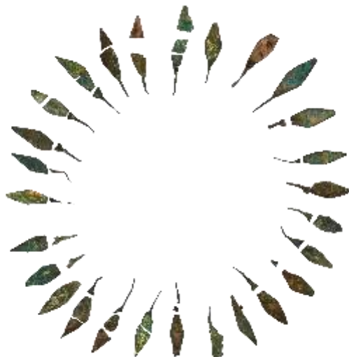
ΕΙΚ. 9: ΕΠΙΧΡΥΣΩΜΕΝΟ ΧΑΛΚΙΝΟ ΣΤΕΦΑΝΙ