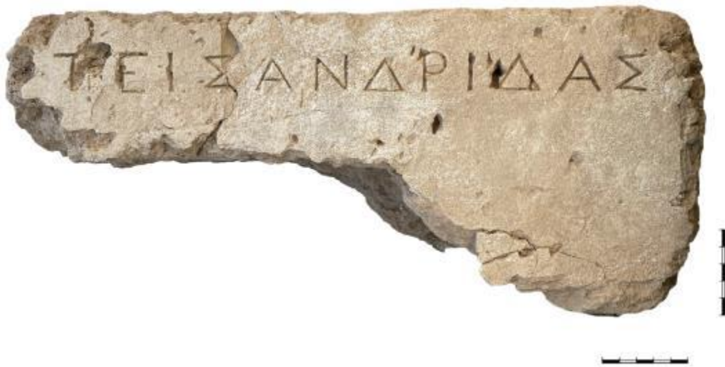
ΕΙΚ. 22: ΛΙΘΙΝΗ ΕΠΙΓΡΑΦΗ ΚΛΑΣΙΚΩΝ ΧΡΟΝΩΝ 4 ΟΥ ΑΙ. Π.Χ. ΣΕ ΒΑΘΡΟ ΑΓΑΛΜΑΤΟΣ