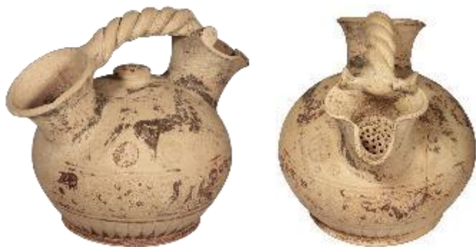
ΕΙΚ. 4: ΔΙΠΛΟΣΤΟΜΟΣ ΑΣΚΟΣ ΜΕ ΤΡΙΦΥΛΛΟΣΤΟΜΗ ΗΘΜΟΕΙΔΗ ΠΡΟΧΟΗ