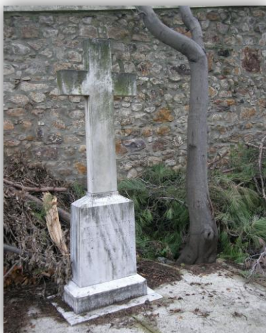
Πίν. 2: Ο τάφος του Αντωνίου Μάγκου στην μονή Αγίου Νικολάου στην Πρίγκηπο (φωτ. 2011, Αλέξανδρος Γ. Παπαζογλου)